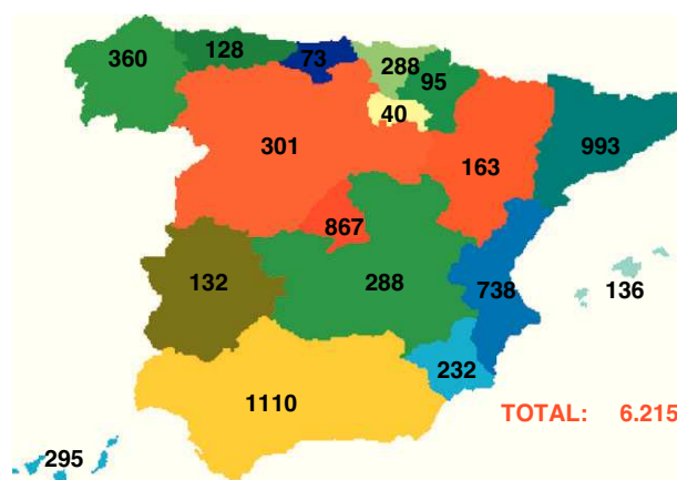
Figura 1. Plazas de pediatría de atención primaria en España, totales y por comunidades autónomas (Ministerio de Sanidad, Política Social e Igualdad. Instituto de Información Sanitaria SIAP. 2008).

En España hay 9544 pediatras 4 , de los cuales el 65% desarrollan su labor profesional en atención primaria (figs. 1 y 2). El número total de plazas se ha incrementado en los últimos años en un 13%, mucho menos que el incremento porcentual de la población de 0 a