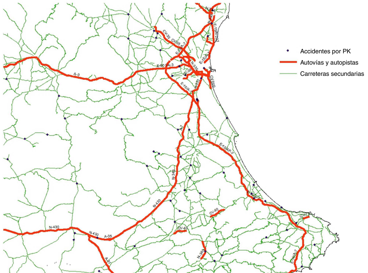
Figura 2. Ejemplo de la distribución espacial de los accidentes de tráfico.

el mapa del informe presentado en 2011 33 con nuestros resultados se observan algunos puntos comunes, aunque tanto la metodología empleada como los períodos de estudio son diferentes. Las carreteras donde se concentra la mayor densidad de Kernel de accidentes de tráfico con víctimas mortales a 24 horas por km 2 /año en nuestro estudio aparecen en el mapa que presenta EuroRAP como tramos de riesgo medio o medio-alto, lo mismo que aquellas áreas en las que aparecen entre cinco y diez accidentes, que también aparecen