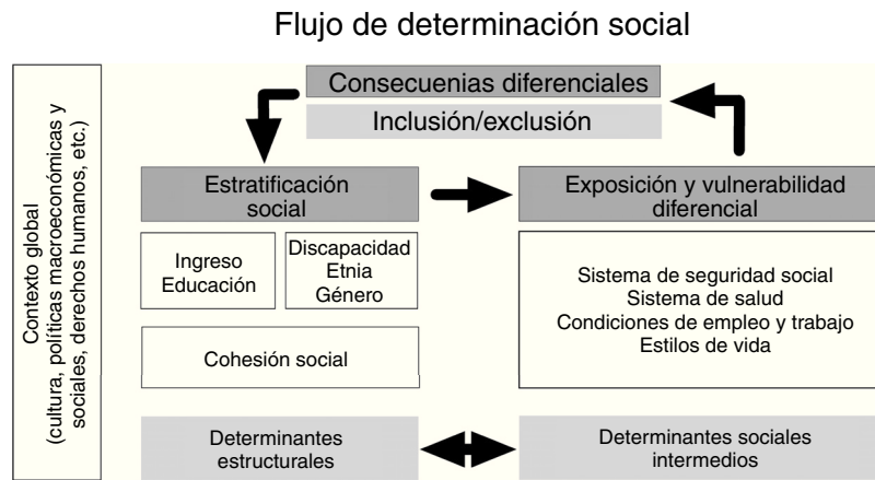
Figura 2. Propuesta de actualización de modelo de determinantes sociales de la salud. Elaboración propia, a partir del esquema de la Comisión de Determinantes Sociales de la Salud, OMS (2005).

Así, proponemos utilizar la relación entre inclusión y exclusión social como resultante de la acción de los DSS. La inclusión social se refiere a las oportunidades que tienen los individuos para participar en áreas clave de la vida económica, social y cultural 1 . A su vez, el término «exclusión social» describe la alienación o la privación de derechos que ciertos individuos o grupos pueden sufrir dentro de la sociedad. A los excluidos socialmente se les atribuye poco valor social; pueden estar marginados económica, política y socialmente, y no pueden disfrutar de las oportunidades económicas y sociales disponibles para otros, incluyendo el disfrute de una buena salud. La exclusión social niega a las personas sus derechos humanos fundamentales.