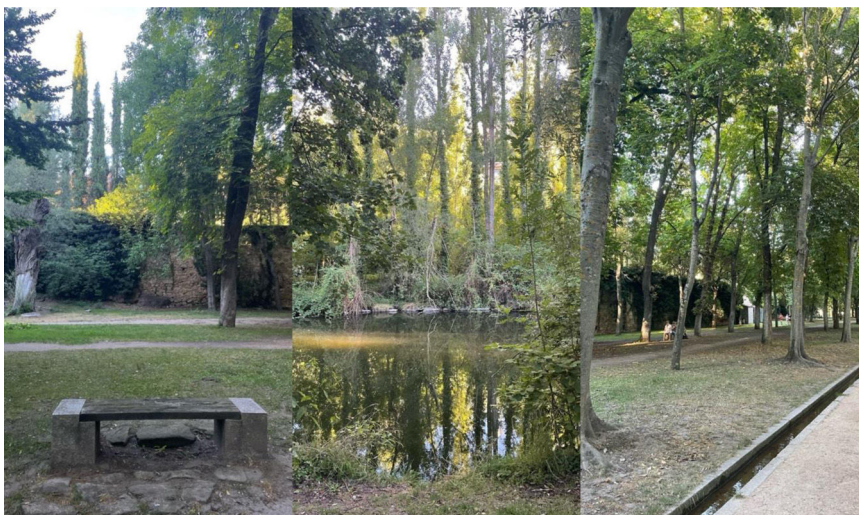
Figura 1. Zona de captura de los mosquitos en Segovia.