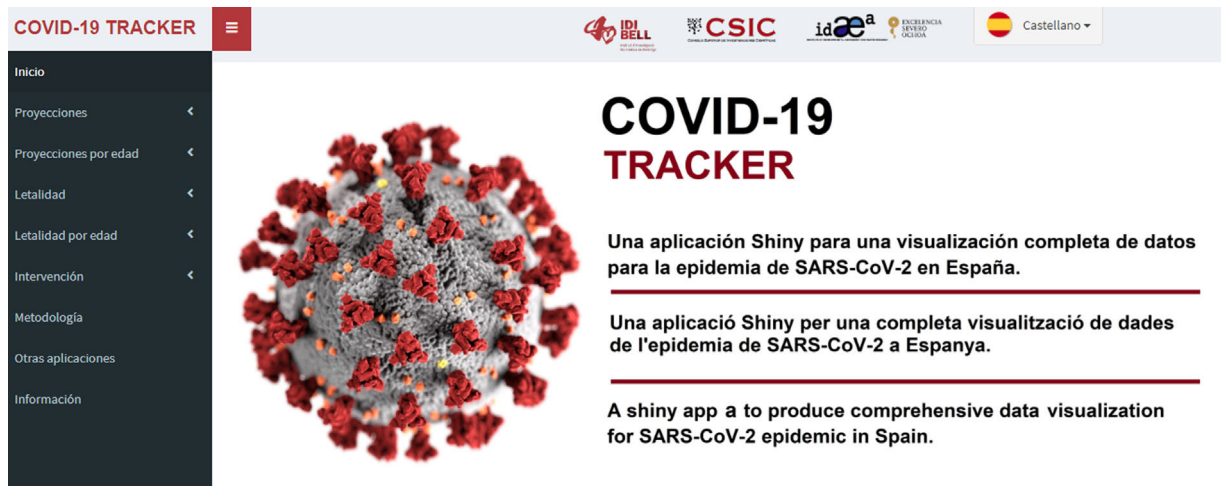
Figura 1. Página web de inicio de la aplicación COVID19-Tracker para la visualización y el análisis automatizado de datos de la epidemia de SARS-CoV-2 en España. Disponible en: https://ubidi.shinyapps.io/covid19/ .

febrero de 2020. Estos datos se recogen diariamente de forma automática del repositorio de Datadista en GitHub 4 . En este repositorio se mantienen actualizados en formato adecuado los datos publicados por el Ministerio de Sanidad, Consumo y Bienestar Social, a través del Instituto de Salud Carlos III 2 .