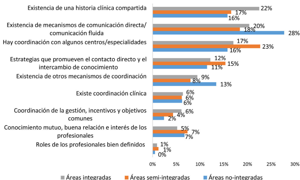
Figura 1. Motivos de una percepción de coordinación positiva en el territorio según la gestión de la atención primaria y especializada.