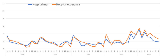
Figura 2. Evolución mensual de la tasa de incidencia de incapacidad temporal por contingencias comunes, por 1000 personas-día, del Hospital del Mar de Barcelona en sus dos principales centros asistenciales, de enero de 2018 a agosto de 2022.

COVID-19, y no fue hasta el último trimestre de 2021 cuando se produjo un incremento de hasta 4 por 1000, pero volviendo a los valores anteriores a la pandemia a finales de 2022.